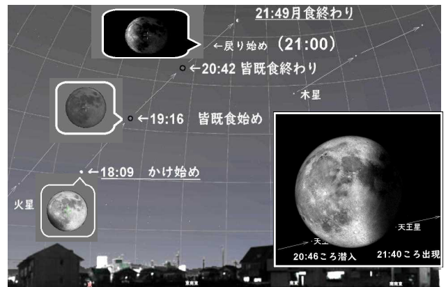
月食時の月の動き ↑

【参考までに黒石市での潜入と出現の時間を記しておきます】 黒石市で潜入は 20:46 ころ、出現は 21:40 ころです。